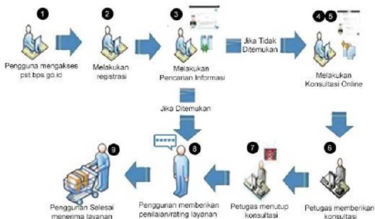
Bagan 2. Prosedur Pelayanan Konsultasi Statistik dengan Cara Online