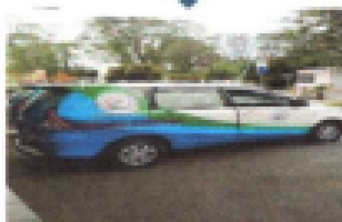
Pasien pulang/ dirawat inap/dirujuk