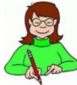
Menandatangani general consent