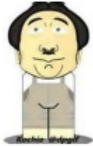
Penanggung jawab pasien