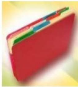
Berkas rawat inap