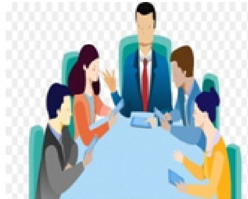
4. Bidang Terkait