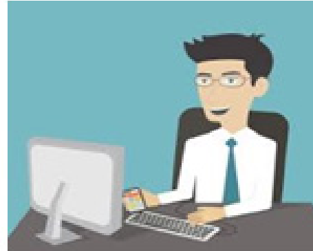
2. Staf informasi