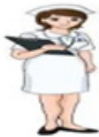
3. Serah terima pasien