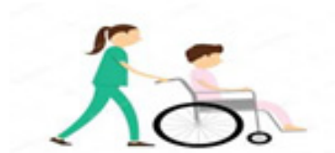
2. Mengantar pasien