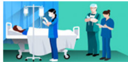
4. Asuhan medis dan keperawatan Perencanaan pulang