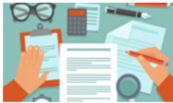
5. Penyelesaian administrasi