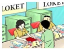
Pengambilan nomor antrian pendaftaran