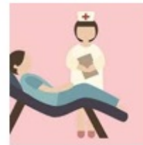
Pemeriksaan oleh bidan Pemeriksaan penunjang dan pemberian terapi