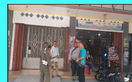
Pengecekan Lapangan Tim Teknis