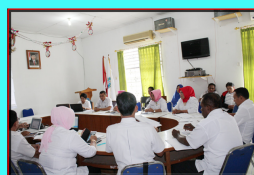
Rapat Koordinasi Tim Teknis