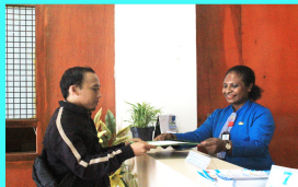
Penyerahan Surat Izin