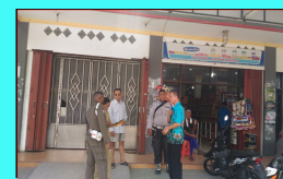
Pengecekan Lapangan Tim Teknis