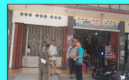
Pengecekan Lapangan Tim Teknis