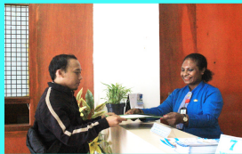
Penyerahan Surat Izin