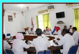
Rapat Koordinasi Tim Teknis