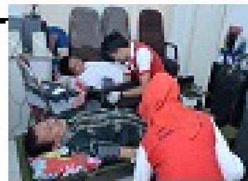
Pengambilan Darah Pendoron