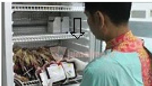
Penyimpanan darah ( Blood Bank )