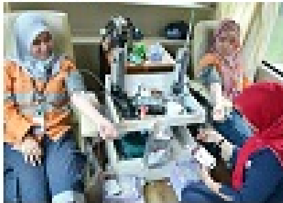
Proses Skrining Darah