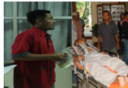
Petugas timbang terima