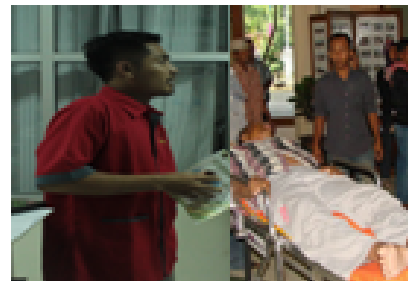
Petugas timbang terima