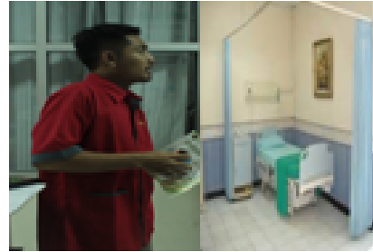
Petugas mengantar ke ruang intensif