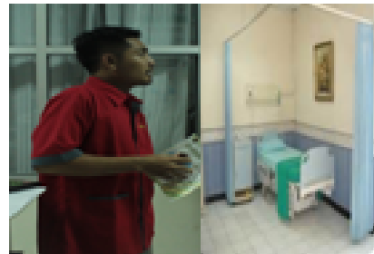
Petugas mengantar ke ruang intensif