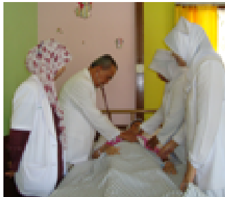
Asuhan medis dan keperawatan