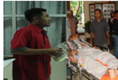
petugas timbang terima pasien & orientasi