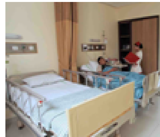
Petugas mengantar ke ruang rawat inap