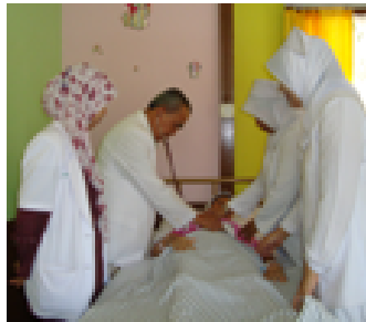
Asuhan medis dan keperawatan