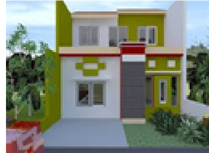
Ditemukan bangunan tdk ber IMB