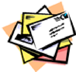
Pembatasan Keg. Pembangunan