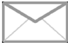
Surat teguran 1 s/d 3