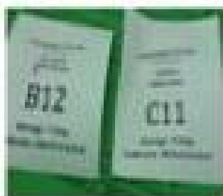
Menerima nomor antrian di poli yg dituju