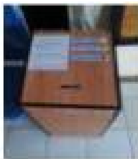
Mengambil nomor antrian loket