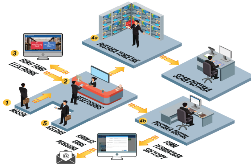
Bagan 1. Prosedur Pelayanan Perpustakaan